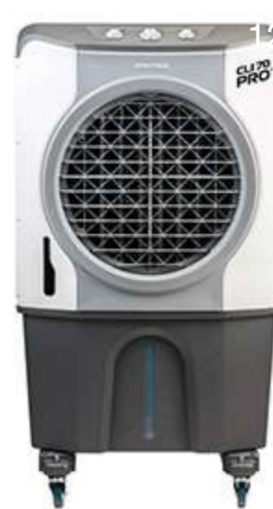
CLIMATIZADOR CLI70 PRO2 CLI70PRO2-01 70 LITROS 210W COD 011268