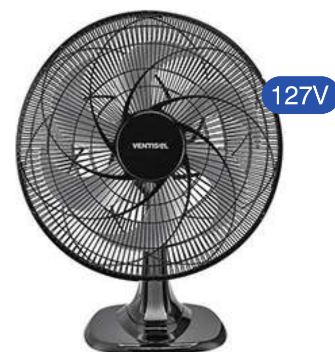
VENTILADOR OSC MESA TURBO 6P 50CM PR COD 011260