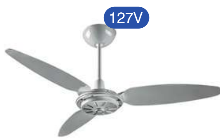
VENTILADOR COMERCIAL CZ 3P CZ RV PREMIUM COD 011257