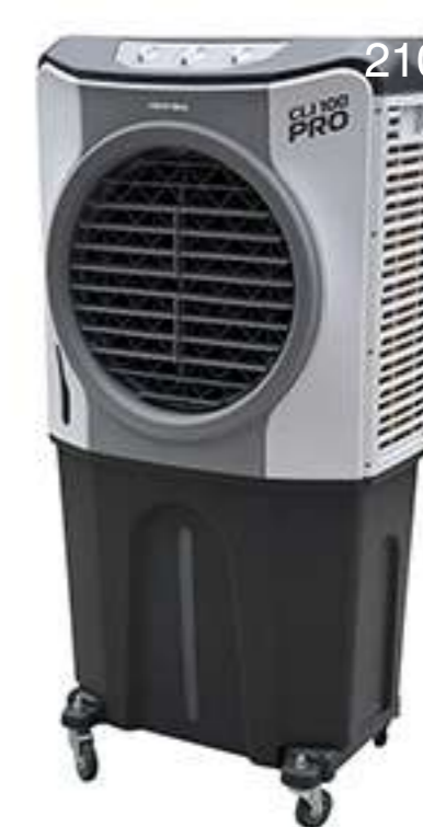
CLIMATIZADOR CLI PRO 100 LITROS EVAPORATIVO INDUSTRIAL VENTISOL COD 011266