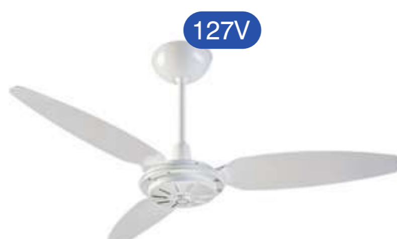
VENTILADOR COMERCIAL BR 3P RV 127V PREMIUM COD 011256