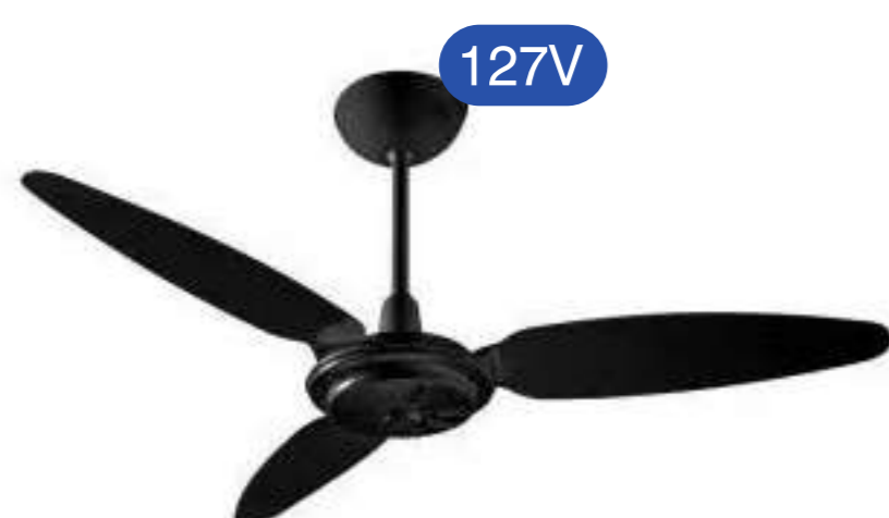
VENTILADOR COMERCIAL PR 3P PR RV PREMIUM COD 011258