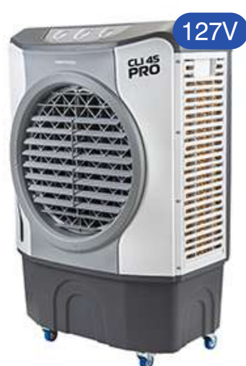
CLIMATIZADOR CLI45 PRO2 CLI45PRO2-01 45 LITROS 210W VENTISOL COD 011267