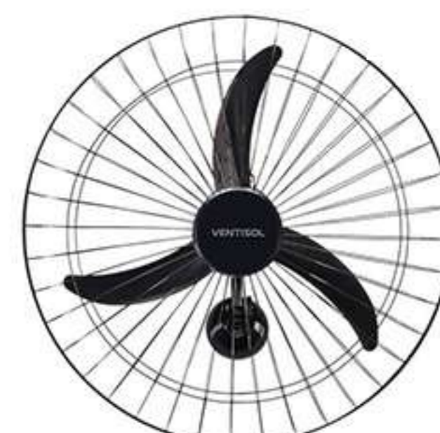
VENTILADOR OSC PAREDE 60CM NEW PR GR PR PREMIUM COD 011263