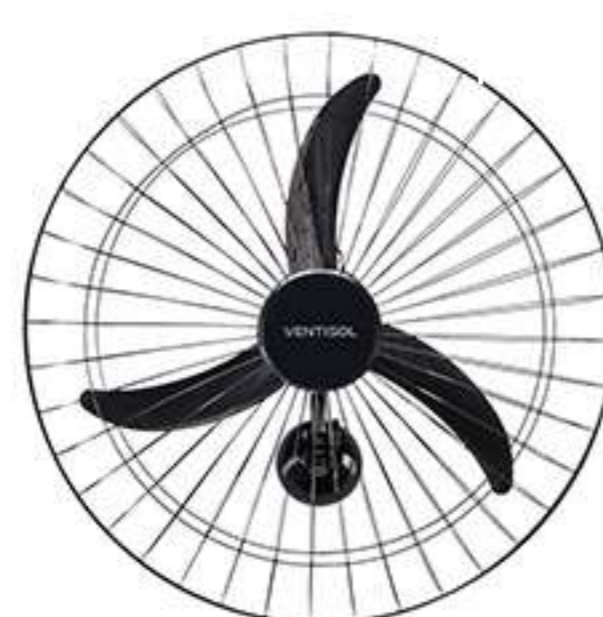
VENTILADOR OSC PAREDE 60CM NEW PR GR PR PREMIUM COD 011262