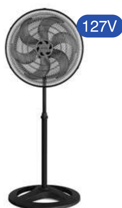
VENTILADOR OSC COLUNA TURBO 6P 50CM PR COD 011259